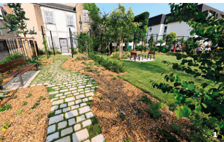
1. Jardin Auguste de Saint-Hilaire