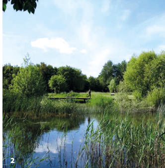
2. Parc de la Fontaine de l'Étuvée

Dimanche 20 avril à 15h, samedi 17 mai à 14h30, dimanche 8 juin à 10h30, samedi 21 juin à 14h30