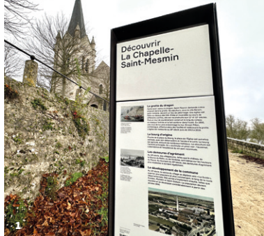
1. Panneau de signalétique métropolitaine à La Chapelle-Saint-Mesmin